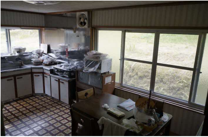
ダイニングキッチン